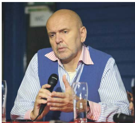
Podľa nového majiteľa klubu takých dobrých fanúšikov, ako má DAC, nemá ani jeden futbalový klub.

Dodatočne vysvetlil aj to, že kúpu majoritného balíka akcií nepovažuje za porušenie svojho slova z minulosti. Niekoľko týždňov pred jeho roz-