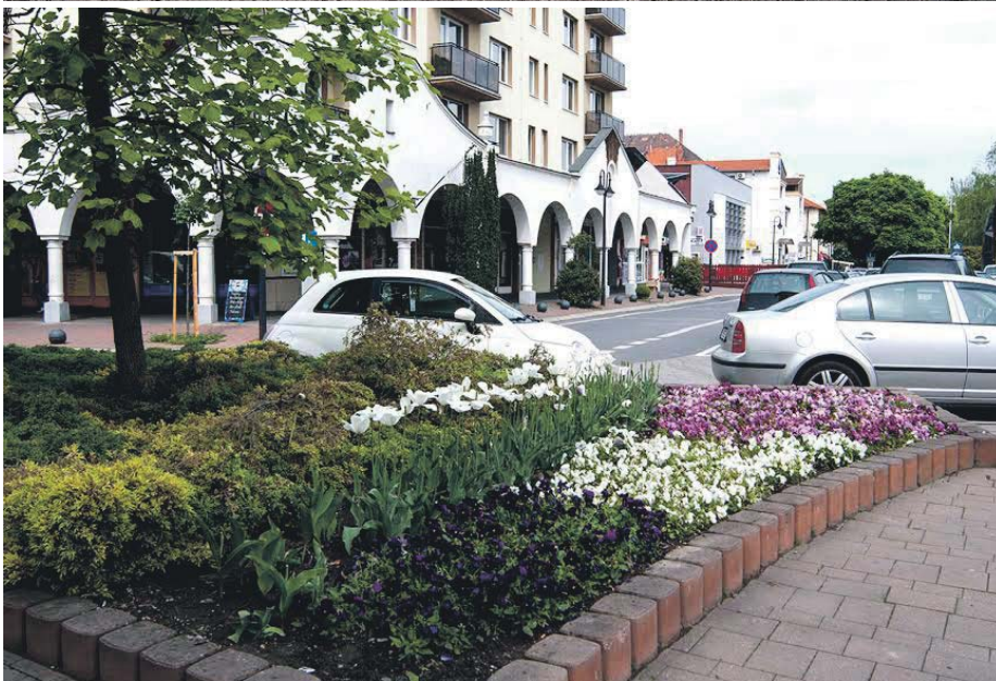
Tavaszi virágültetés a közterületeken. / Jarná výsadba kvetín na verejných priestranstvách.