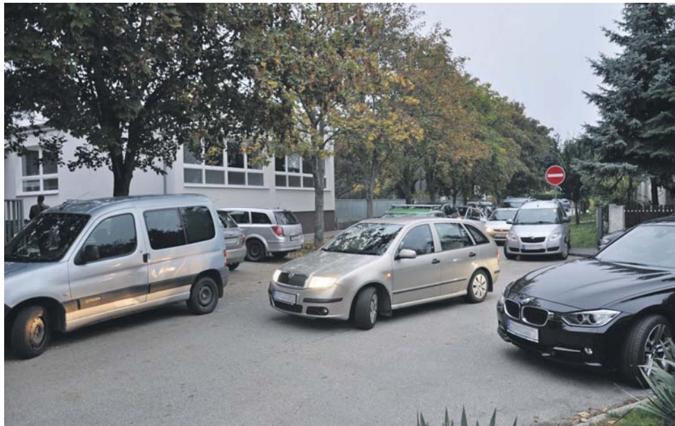
A szülők többsége autóval hozza gyermekét az iskolába. A sok kocsí a környékbeli utcákban lakók közlekedését is akadályozza. / Väčšina rodičov vozí svoje dieťa do školy autom. Tento nárust út blokuje dopravu obyvateľov priľahlých ulíc.