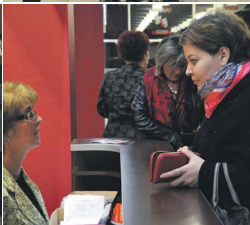
Közvetlenül az előadás előtt az utolsó jegyek is elkeltek.