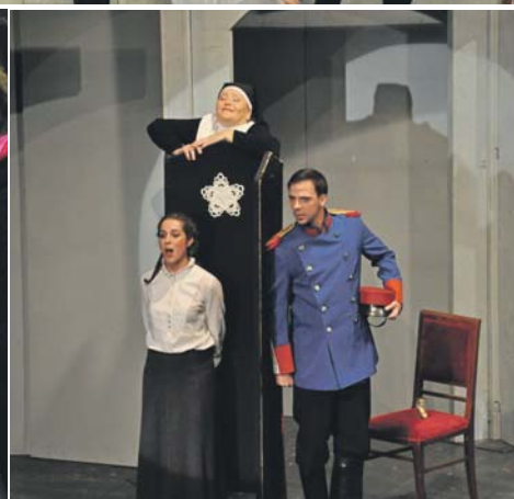
A szerelmek és a zárdafőnöknő.