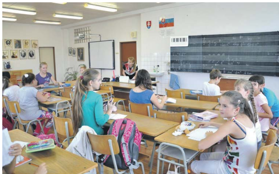
Szép számmal vannak növendékek, akik két-három szakot is látogatnak.

A Művészeti Alapiskolában négy szak látogatható: zene, tánc, képzőművészet és színjátszás