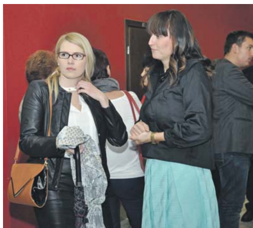
Benépesül az előcsarnok.