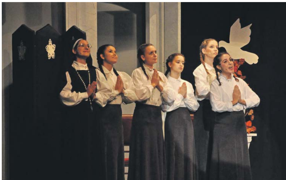
Zbožné chovankyne kláštornej školy.

Veľa abonentiiek zakúpili do daru rodičom, starým rodičom, ktorí síce obľubujú divadlo, ale z dôvodu si nemôžu dovoliť vstupenky. Abonentka navyše poskytuje istotu, že jej majiteľ nemusí sedieť na kraji alebo na náhradnej stoličke a má isté dobré miesto v divadelnej sále.