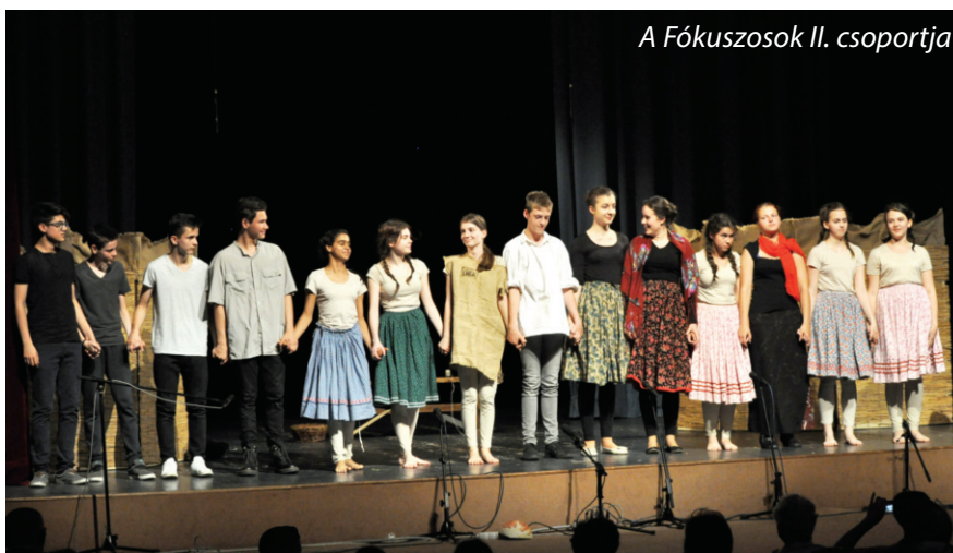
A Fókuszosok II. csoportja

+ a Dunaszerdahelyi Csaplár Benedek Városi Művelődési Központ és a Csemadok Vámbéry Ármin Alapszervezet Fókusz Gyermekszínpada II. csoportjának az Árvácska előadásáért, rendezte: Jarábik Gabriella és Kuklis Katalin