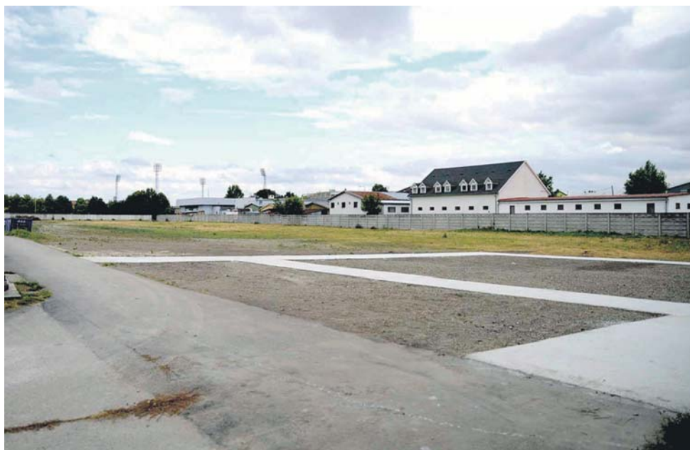
Rozšírená časť cintorína.

Databázy mestských cintorínov od augusta sú prístupné aj na internete na adrese www.virtualnycintorin.sk . Údaje sa priebežne obnovujú.