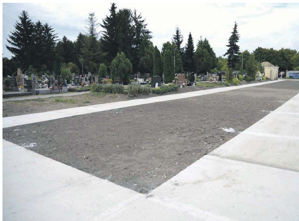
Rövidesen már itt lesznek az új sírok.

Az új temetőrészben már következetesebben fogják megkövetelni bizonyos szabályok betartását. Egyebek közt azt, hogy önkényesen nem betonozhatnak le a sír mellett területet és padot sem lehet bárhova elhelyezni. A mostani temetőrészben nagy gondot okoz az előzetes egyeztetés nélküli betonozás a sírok körül. Több helyen összefüggő nagy területeket betonoztattak le a hozzátartozók. Ha esik az eső, nincs hova