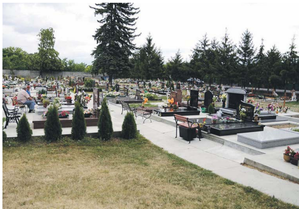
V tejto časti cintorína je už len málo hrobových miest.

V novej časti cintorína budú správcovia dôslednejšie vyžadovať dodržiavanie určitých pravidiel. Okrem iného aj to, že nebude možné svojvoľne zabetónovať plochu okolo hrobu a nemožno hocikde poostaviť lavičku. V súčasnom cintoríne spôsobujú nemalé problémy práve takéto, ni-