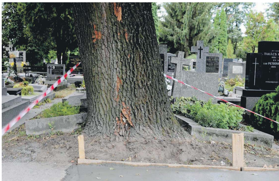
A terebélyes gyökérzetű lomblevelű fa évek múltán megemeli a sírkeretet.

Augusztustól a weben is elérhetőek a dunaszerdahelyi köztemetők, a www.virtualnycintorin.sk címen, amelyen magyarul is lekérdezhető az adatok. Ezen a weboldalon folyamatosan töltik fel az adatokat.