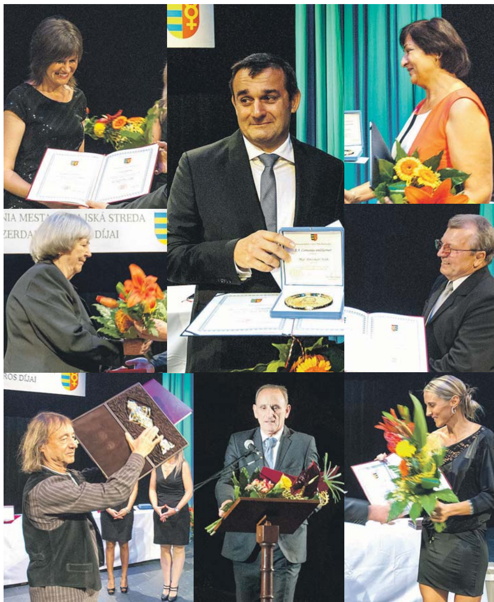
Pillanatképek az idei városi díjátadó ünnepségről. / Momentky zo slávnostného odovzdania tohoročných mestských ocenení.