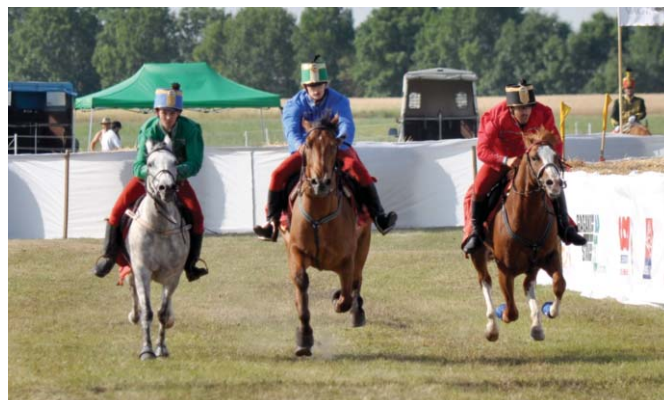
III. ŽITNOOSTROVSKÝ GALOP