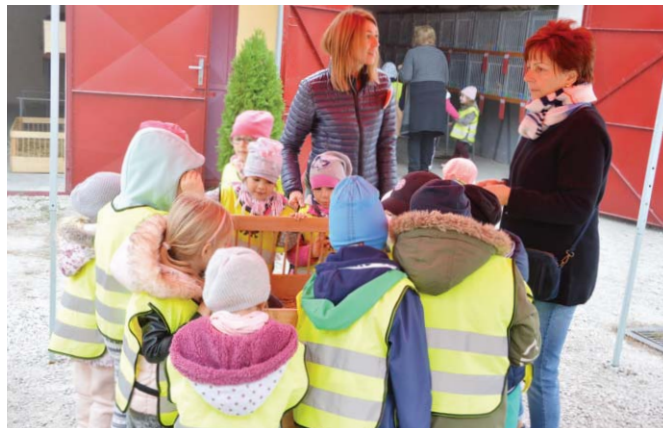
SZINES – FAREBNÉ

A sok-sok szárnyast – tyúkot, kakast, kacsát, libát, galambot, fácánt –, törpe és nagy termetű nyulat, vagy éppen az egzotikus madarakat kíváncsi szemek csodálhatták meg a Kistejedi úton, majd vasárnap ünnepélyes díjátadóra is sor került. A versenyző-