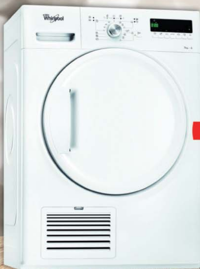
Whirlpool DDLX 70110 Kondenzačná sušička