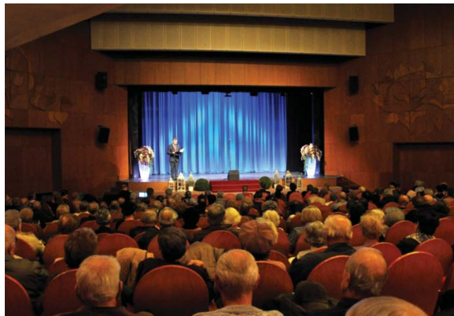
KÖZÉPDEKŰ – PRE VEREJINOST

A polgármester rámutatott a hiányosságokra is. „Oktatási intézményeink konyháinak felmérésekor szembesültünk az elavult konyhai berendezésekkel, a korszerűtlen helyiségekkel.