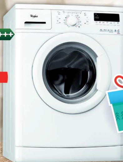
Whirlpool AWO/C 6304 Automatická práčka