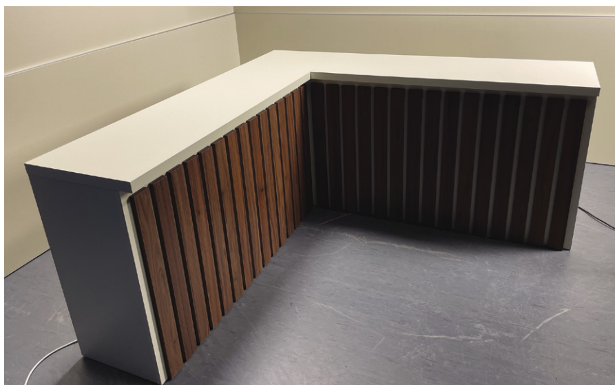
Postupne sa obnovilo televízne štúdio