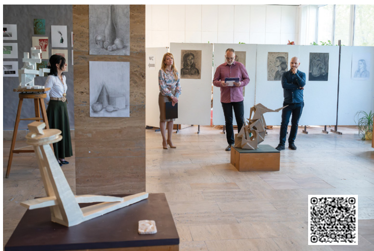
Kiállításmegnyitóval és koncerttel ünnepelte fennállása 65. évfordulóját a Dunaszerdahelyi Művészeti Alapiskola